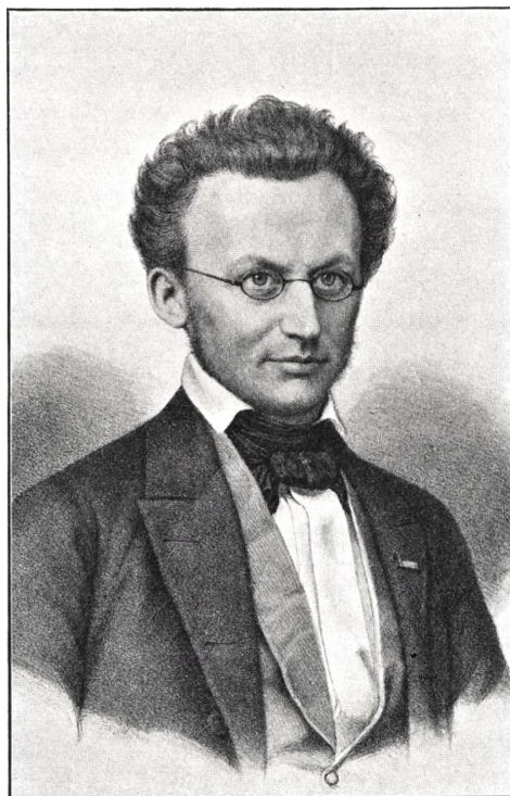
Japetus Steenstrup 1855. Efter Lithografi.

I Sorø læste Steenstrup for Akademiets Studenter over Botanik og Mineralogi, medens Digteren HAUCH bestred Zoologien; kun i Skolen underviste Stp. ogsaa i Zoologi. Ikke desto mindre blev det her netop Zoologien, hvormed han samlede sit Arbejde. I Sorø skrev han de to Programmer: om Generationsvexelen (1842) og Hermafroditismen (1845), der baade herhjemme og i Udlandet vakte stor Opmærksomhed. Efter REINHARDTS Død blev STEENSTRUP udnævnt til Professor i Zoologi ved